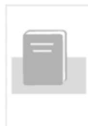
现代人力资源管理