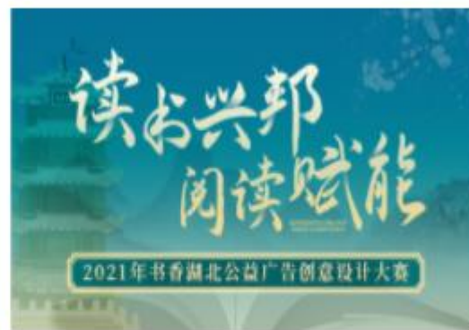
(已结束) 2021年书香湖北公益广告创意设计大赛