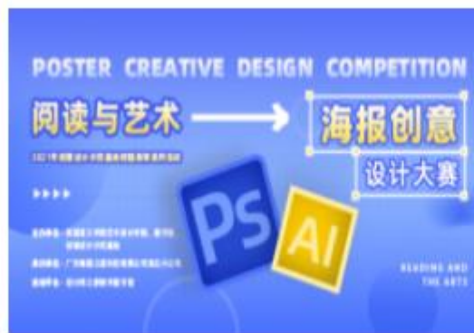
(已结束) “阅读与艺术”海报创意设计大赛