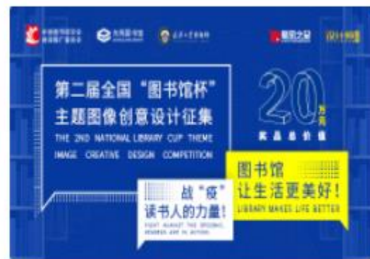
(已结束) 第二届全国“图书馆杯”主题图像创意设计征集活动