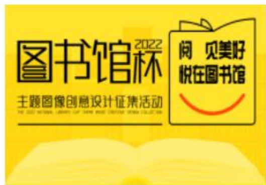
(进行中) 2022年“图书馆杯”主题图像创意设计征集活动