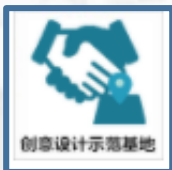
创意设计示范基地